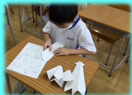
紙ひこうきもたくさん折りました。

きょうは「パラリンピック」の開会式。下校前に記念館の屋上でブルーインパルスを見ました。武蔵野市の上空を何度も旋回してくれてとってもラッキーでしたね。