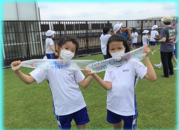
午前中に、TOKYO2020をデザインした傘袋ロケットを作りました。