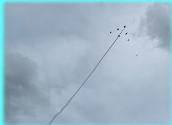
キターーーーッ!まさかの記念館の真上だ。