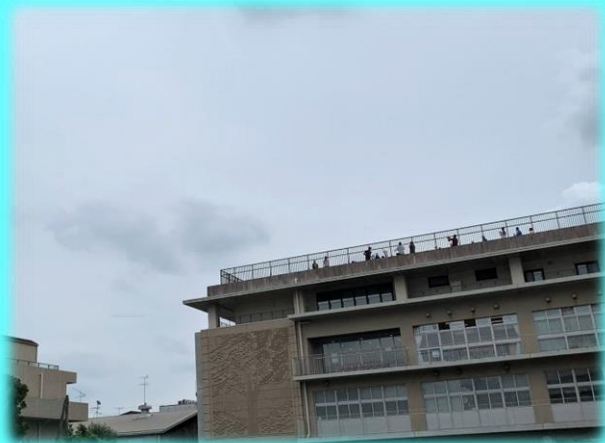
北原記念館の屋上で、スタンバイOK!