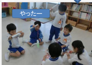
次の日ほかのクラスでも