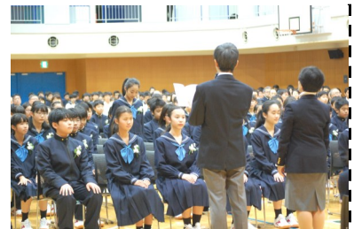
担任の先生が一人ひとりの名前を読み上げます。