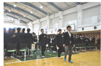
いよいよ明日から登校！