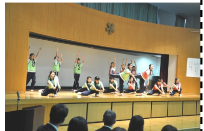
先輩たちによる歓迎会