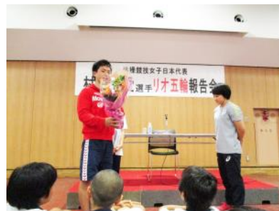
村上先生と妹（中3在籍）から花束贈呈