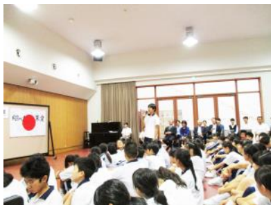
生徒たちからの質問の時間