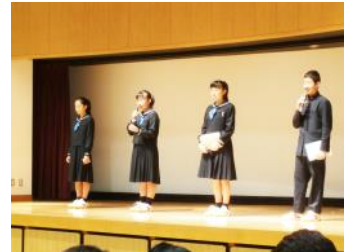
先輩たちによる歓迎会が始まります。