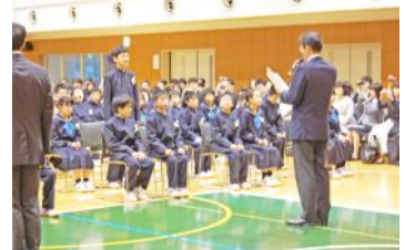
担任の先生が一人ひとりの名前を読み上げます。