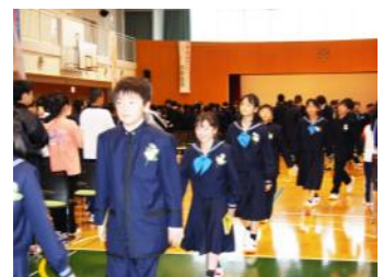
いよいよ明日から登校！