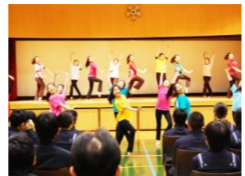
部活のパフォーマンス